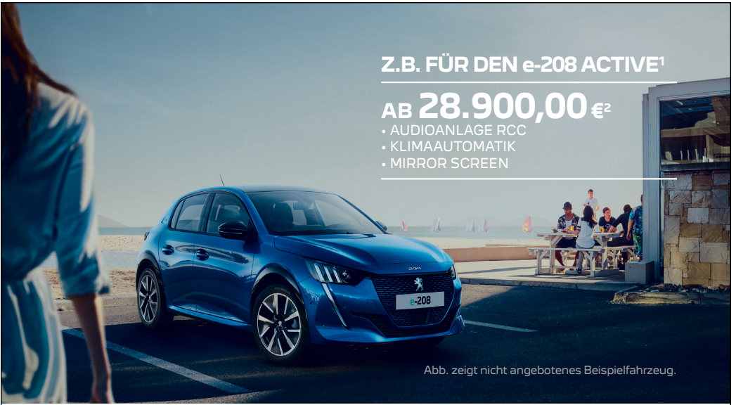
Abb. zeigt nicht angebotenes Beispielfahrzeug.