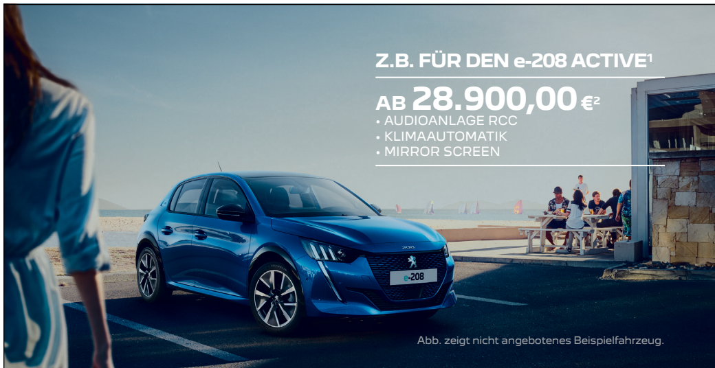
Abb. zeigt nicht angebotenes Beispielfahrzeug.